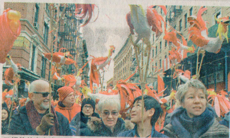
■領養華童家庭打出活靈活現的金雞造型。