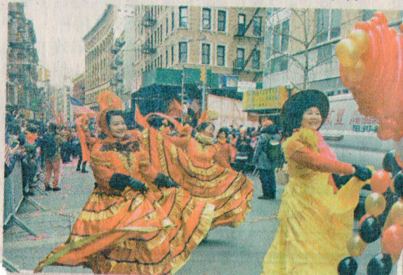
■載歌載舞的遊行隊伍。